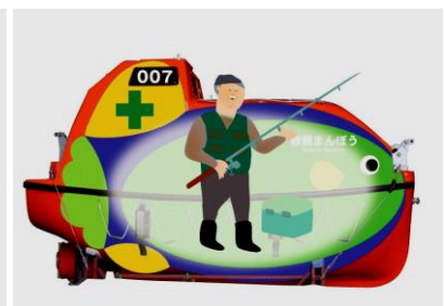
釣り船・遊覧船として