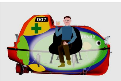
趣味の部屋として