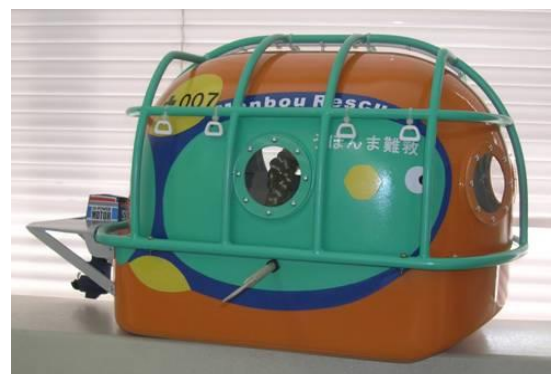
救難まんぼう2 完成予想モデル